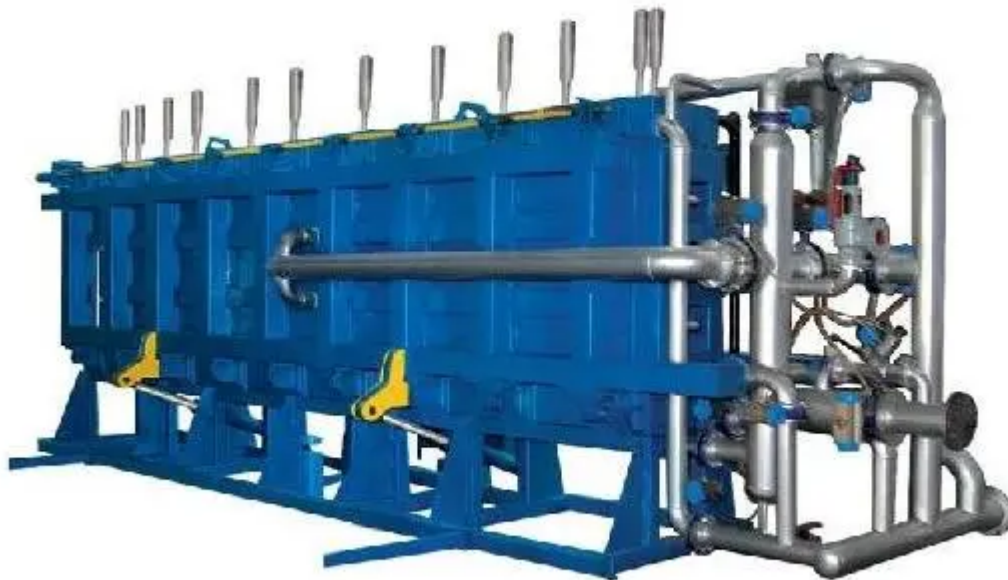
全自动高效节能板材成型机