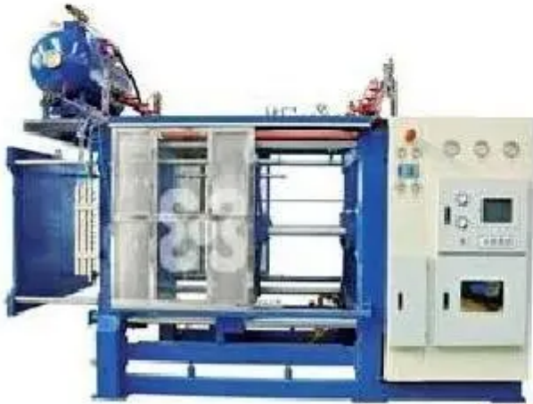
全自动高效节能真空包装成型机