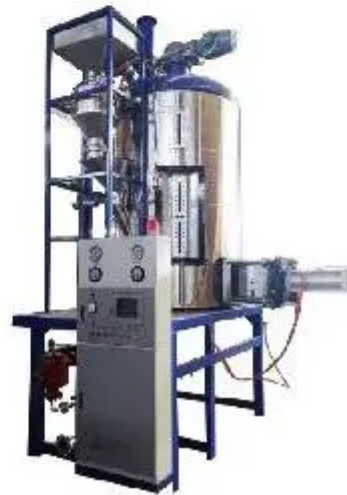
全自动高效节能定量预发机